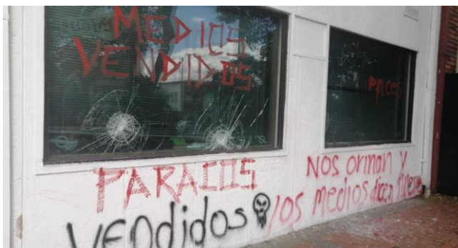
Manifestantes atacaron con piedras y balas de pintura la sede de RCN radio a la altura de la calle 37 con Caracas. 23 de junio.