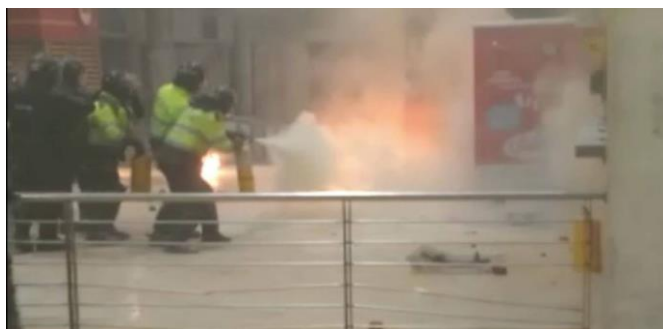
Portal Suba fue atacado con bombas incendiarias. 24 de junio. Fuente: https://caracol.com.co/emisora/2021/06/24/bogota/1624500756_095085.html