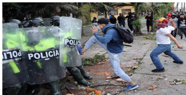
Investigan a un grupo de manifestantes por presunta tortura a policías. 24 de junio. Fuente: https://www.bluradio.com/nacion/investigacion-a-un-grupo-de-manifestantes-por-presunta-tortura-a-policias Foto: El Comercio Perú/ EFE/Carlos Ortega.